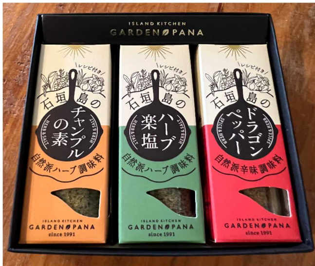
<調味料3種がぴったり入るギフト箱>