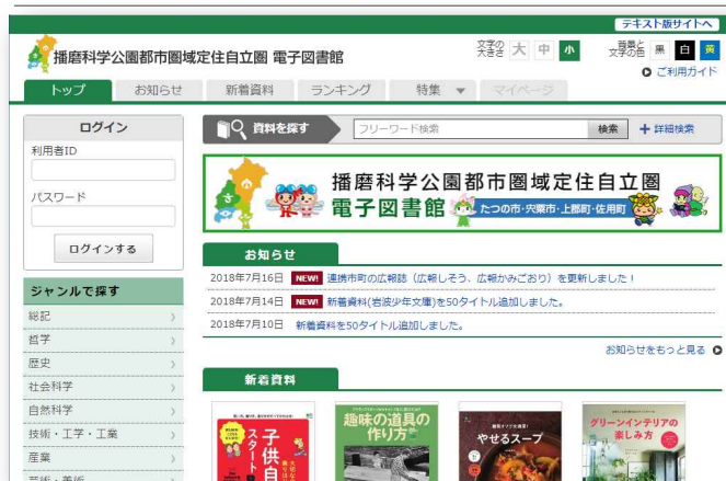
播磨科学公園都市