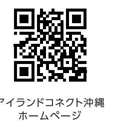
アイランドコネクト沖縄 ホームページ

【お申し込み・お問い合わせ先】 アイランドコネクト沖縄 事務局 info@icokinawa.com / https://icokinawa.com