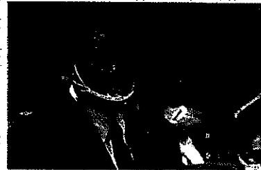
沖縄県議会 第7回定例会 一般質問 (2月7日) 要旨報告