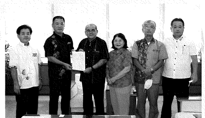
県議会議会 要請 6月22日 北中城村議会から県道宜野湾北中城線の早期完成に係る要請

施設関係者や市町村との連携、県民への周知啓発など、制度の円滑な導入に向けて速やかに取り組んでまいります。