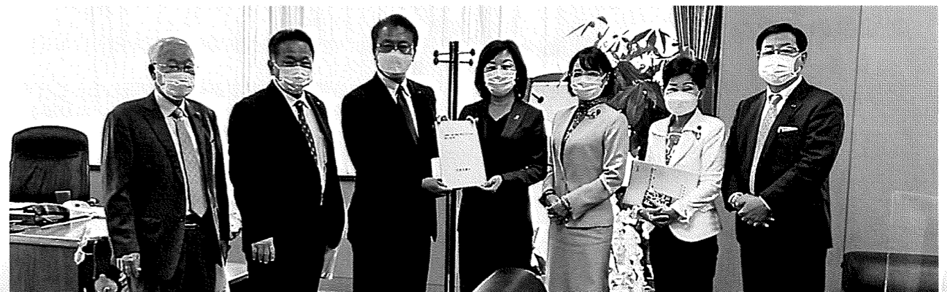
野田聖子 地方創生担当大臣 要請 11月5日(金) 超党派でコロナ・軽石に係る、地方創生臨時交付金増額を含む必要な財源措置を求める。

そのため、私は主役である県民の皆様と情報を共有し、議会や行政の改革で前例主義を打破して「県民の命と暮らしを守る」施策に全力で取り組んでいくことをお約束いたします。