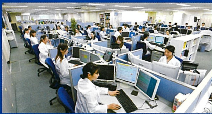
ご相談に対応するヘルスカウンセラー