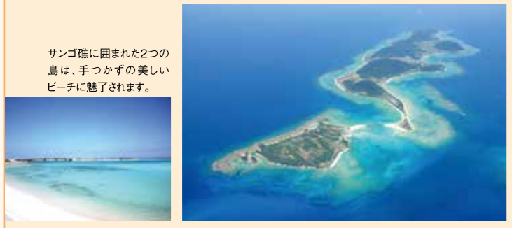
サンゴ礁に囲まれた2つの島は、手つかずの美しいビーチに魅了されます。