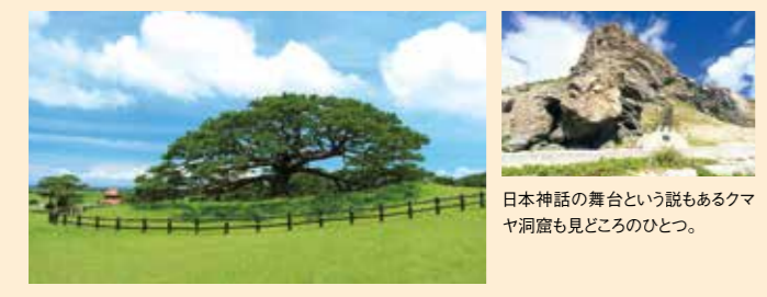
日本神話の舞台という説もあるクマヤ洞窟も見どころのひとつ。

phrase 3 伊平屋島には広いキャンプ場があり、バーベキューやシーカヤックが楽しめます。