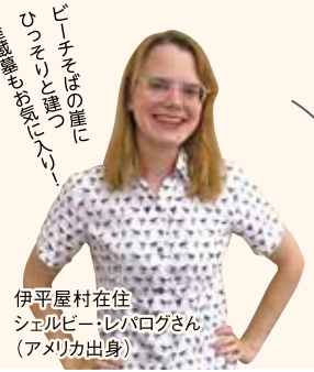
ビーチそばの崖にひっそりと佇む「クバ山」