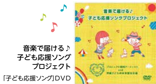
音楽で届ける♪ 子ども応援ソング プロジェクト 「子ども応援ソング」DVD

児童養護施設等を退所し、大学等へ進学する子ども達に入学金と授業料の全額を給付する「子どもに寄り添う給付型奨学金」や県民会議の構成団体等が協働して取り組む事業に対して最大500万円、最長3年間の助成を行う「子ども未来ジョイントプロジェクト助成事業」などを展開しております。