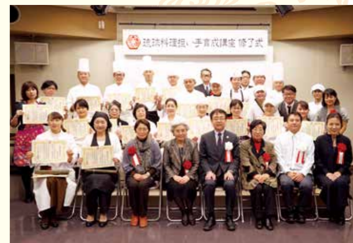
平成30年 琉球料理担い手育成講座修了式

これらの取り組みにより、県民が伝統的な食文化の価値を再認識し、愛着と誇りをもつとともに、伝統的な食文化を観光資源として活用していけることを目指しています。