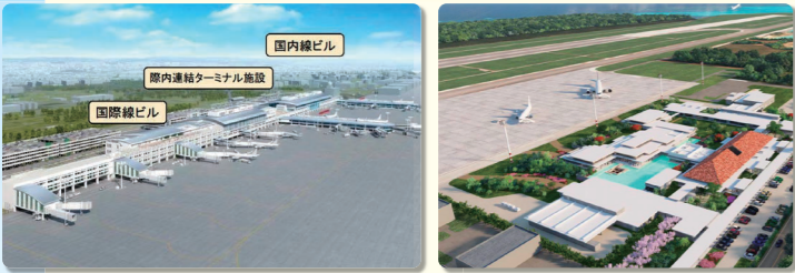
那覇空港際内連結ターミナル施設イメージ 下地島空港旅客ターミナル施設イメージ

今年3月には、那覇空港の国内線と国際線を連結するターミナル施設が整備され、国際線チェックインカウンターが20ブースから60ブースに増加します。