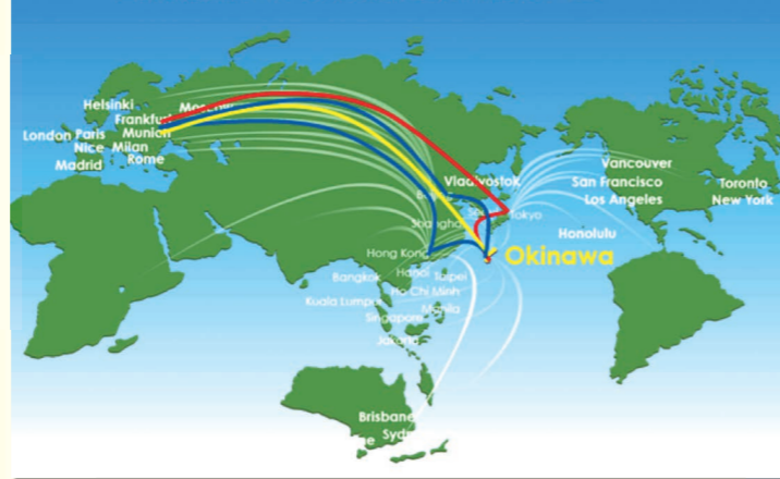
国際旅客ハブの形成に向けたステップ

具体的には3つのステップを考えており、最初のステップとして、訪日旅行に際し、沖縄が国内他都市との周遊の拠点となる段階、次のステップとして、沖縄がアジア旅行の周遊拠点となる段階、そして、最後に、アジア、訪日旅行の最初の拠点として、沖縄が欧州からの直行便の就航地となる段階、これら3つの段階を経て、将来、那覇空港の「国際旅客ハブ」化を目指しています。