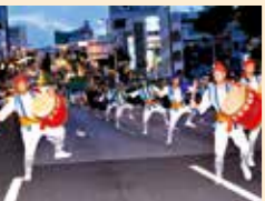
通りで行う演舞「道ジュネー」も、エイサーの醍醐味のひとつ。