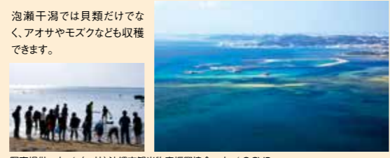
泡瀬干潟では貝類だけでなく、アオサやモズクなども収穫できます。

Eisa, a traditional performing art, is very popular in Okinawa city. The city hosts a momentous Eisa festival every summer.