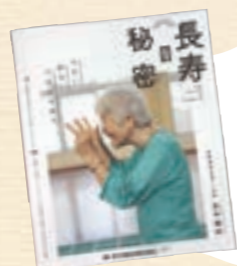
北中城村の「元気」を紹介する観光冊子「長寿の秘密」