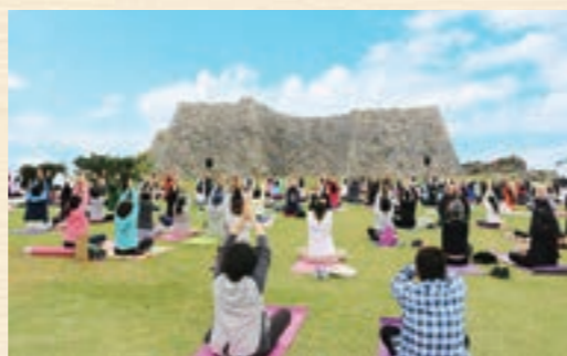
世界遺産・中城城跡をメイン会場に開催する「城ヨガin北中城」