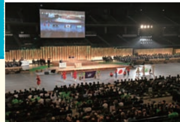
先催県の様子(H30年全国育樹祭:東京都)