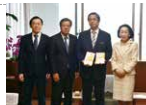
沖縄平和賞委員会への寄付金贈呈式(沖縄経済同友会) (3月22日)