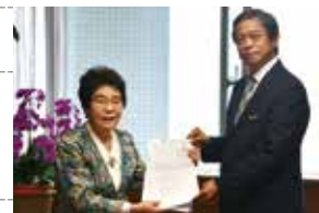
沖縄県女性団体連絡協議会が、3・8国際女性デーについて、謝花副知事に要請 (3月22日)