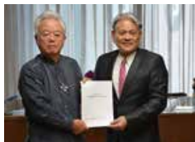
沖縄観光振興に関する提言書手交式(沖縄観光コンベンションビューロー) (3月25日)