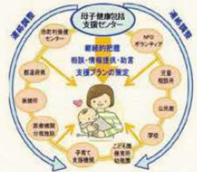
母子健康包括支援センターイメージ 子育て世代包括支援センター業務ガイドライン試案

県では、「地域のなかで、親自身も子育てを通して育ち合いながら、楽しく子育てができる親子」「親子が困った時に、地域や行政へ自ら支援を求めることができる親子」を目指す親子像として掲げ、市町村が母子健康包括支援センターを設置できるよう支援しています。