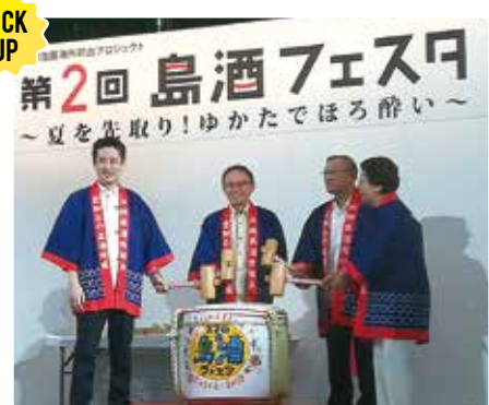
関係者による鏡開き(オープニングセレモニー)