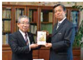
沖縄平和賞委員会への寄付金贈呈式(県農業協同組合中央会) (3月26日)