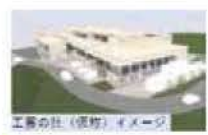
工務の社(仮称)イメージ