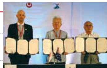
東京2020オリンピック事前キャンプ覚書締結式 (4月12日)