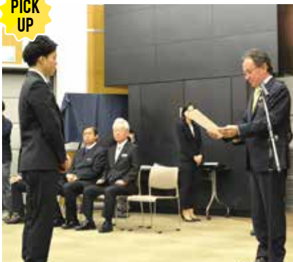
新規採用職員への辞令交付