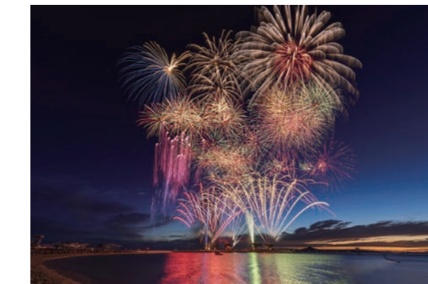
海洋博公園サマーフェスティバル(海洋博公園花火大会) ※写真はイメージ

また、首里城公園では2月から新しいエリアである御内原（おうちばら）が利用できるようになってい す。御内原には、首里城において最も標高が高い東（あがり）のアザナという物見台や、普段は王女の居室であり、国王が死去した際に世子が新たな国王として即位するための儀式を行っていた世誇殿（よほこりでん）などがあります。また、世誇殿内の舞台では、伝統芸能公演として琉球舞踊などの演舞を毎日実施しています。