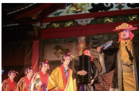
中秋の宴（首里城公園）

他にも、海洋博公園全体を会場とした海洋博公園全国トリムマラソン大会も例年1月頃に実施されています。 毎日開催されているプログラムとしては、観覧無料のイルカショーやイルカ観音会をオキちゃん劇場で実施しているほか、海洋文化館では最大恒星数1億4千万個に及ぶ美しい星空をドームスクリーンいっぱいに表示するプラネタリウムや、実物大（全長15メートル以上）の舟の展示も行っていますので、あわせてご利用ください。 (3) 各施設のイベント実施の詳細については、それぞれのホームページか（一財）沖縄美ら島財団が発行する広報誌「御城（うつくし）だより」または「海洋博美ら海通信」をご確認ください。