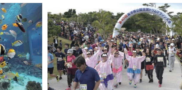
海洋博公園全国トリムマラソン大会 ※写真はイメージ

このほか、コンビニエンスストア等で通常の入場料金よりもお得なチケットを購入できるほか、70歳以上の県民の方は入場料が無料になるサービスも試行していますので是非ご利用ください。