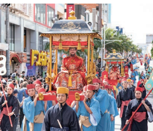
首里城祭・琉球王朝絵巻行列の様子

(1) 首里城公園では、例年9月頃に月明かりに照らされた正殿を背に、人間国宝による最高峰の古典舞踊や組踊が披露される「中秋の宴（うたげ）」を開催しています。このほか、10月から11月にかけて首里城祭も開催されています。首里城祭では、国王や王妃が首里城公園周辺を練り歩く古式行列や、国際通りを舞台として琉球国王・王妃の行列に伝統芸能団などがつぎ、総勢約700名による壮観な世界が繰り広げられる琉球王朝絵巻行列が実施されています。