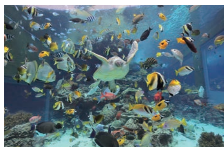
熱帯魚の海（沖縄美ら海水族館）