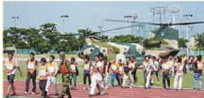
離島、孤立地域からの住民避難