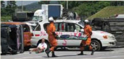
被災現場からの救出