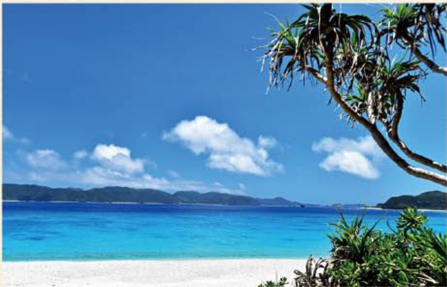
透明度の高い海に真っ白な砂浜のビーチが圧倒的な美しさの古座間味ビーチは、ミシュラン・グリーンガイド・ジャポンで2つ星がついた座間味村の代表的なビーチ。

また最近では世界的に知名度の高い旅行クチコミサイトで日本一美しいビーチとして「古座間味ビーチ」が、見事1位を獲得!「ケラマブルー」とも呼ばれる圧倒的な碧さと透明度抜群の海、海中に広がる世界屈指の数百種にも及ぶサンゴ礁、鮮やかな熱帯魚たちが織りなす海中景観は世界中のダイバーを魅了しています。夏はダイビングやシュノーケリングを始め様々なマリンスポーツを満喫できるほか、冬はザトウクジラの群れが繁殖と子育てのために訪れ、ホエールウォッチングが楽しめる一本島からのアクセスも抜群の世界に誇る楽園です。