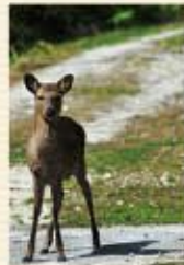
「天然記念物のケラマジカ」はその可愛さから観光客にも大人気です。