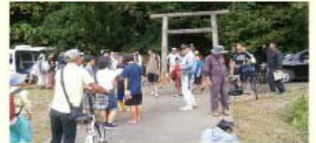
地域と連携した避難訓練