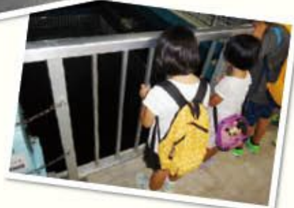
おきなわみずまつりの様子