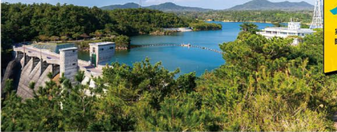
漢那ダム(宜野座村)

平和で豊かな「美ら島おきなわ」の実現に向けて、その道のスペシャリストに聞いてみよう! 僕らが知っておくべきこと・できることをわかりやすく伝えます。