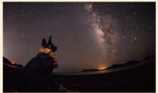
夜は満天の星空が肉眼で見えます。映画「マリリンに逢いたい」のマリリン像が撮影スポットとして人気です。