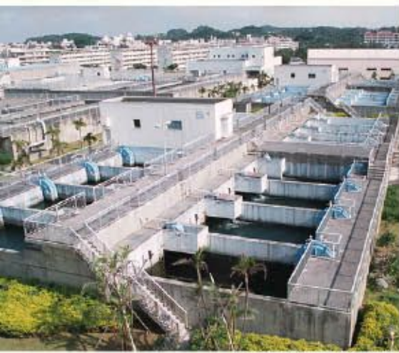
北谷浄水場(現在改良中)