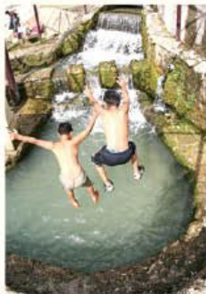
第1回沖縄の水デジタルフォトコンテスト受賞作品

美しい海に囲まれ、豊かな緑広がる沖縄県。私たちが普段何気なく使っている水道水は、貴重な水源を大切にしながら、多くの人の努力によって安心・安全に作られています。では一体、この水はどのようにして、安全に私たちに提供されているのでしょうか? 身近な存在なのに知っているようで意外と知らない、水道について探ります。