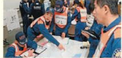
海防応援活動調整本部