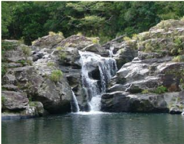
貴重な水源は本島北部に多い

美しい海に囲まれ、豊かな緑広がる沖縄県。私たちが普段何気なく使っている水道水は、貴重な水源を大切にしながら、多くの人の努力によって安心・安全に作られています。では一体、この水はどのようにして、安全に私たちに提供されているのでしょうか? 身近な存在なのに知っているようで意外と知らない、水道について探ります。