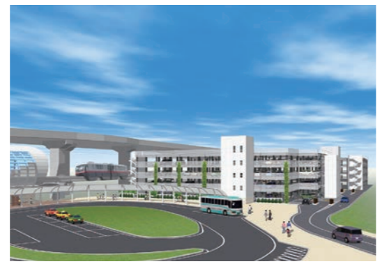
パークアンドライド駐車場 完成予想

最終駅てだこ浦西駅の隣に992台収容できるパークアンドライド駐車場がオープンします。パークアンドライドとは、マイカーを最寄り駅等周辺の駐車場に駐車(パーク)し、電車などに乗り換えて(ライド)移動する方法のことで、車から公共交通機関へ乗り換えることで、渋滞の緩和にも繋がります。パークアンドライドシステムは、通勤時間帯の渋滞のイライラからも解放され、またマイカー利用時よりも歩く距離が少し増えるので、とても健康的な移動方法だと思いませんか? また、旅行など空港を利用する