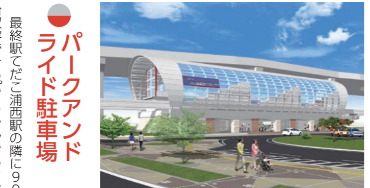
てだこ浦西駅 完成予想

トンネルを抜けるとすぐに最終駅のてだこ浦西駅が見えてきます。ゆいレール唯一の地上駅の特性を生かした大屋根形状とし、ホーム階はガラスやたくさんの小さい穴が開いた壁を使用することで、ホーム内に自然光が差し込む明るく開放的な空間を創出しました。駅舎下部の外壁には、沖縄の強い日差しや通り雨を避けられるようアマハジ(雨端庇・軒)をイメージした回廊を設け、花