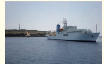
南大東島への海底光ケーブル敷設 (平成23年)

これにより、通信事業者による高品質かつ安価な高度情報通信サービスを提供する環境が整い、大東地区の産業振興や定住条件の整備などに貢献することが期待されています。