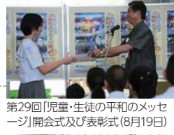
第29回「児童・生徒の平和のメッセージ」開会式及び表彰式(8月19日)

19日 玉城知事が、愛知県へ表敬訪問等(～20日) デニー知事トークキャラバンin名古屋 第29回「児童・生徒の平和のメッセージ」 開会式及び表彰式