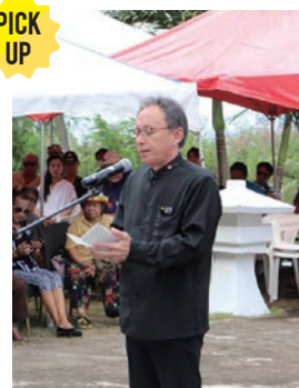
追悼の言葉を捧げる玉城知事