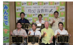
沖縄県産業・雇用拡大県民運動推進功労者表彰式(8月30日)

30日 第一生命保険との包括的連携協定締結式 沖縄県産業・雇用拡大県民運動推進功労者表彰式 令和元年度健康長寿おきなわ復活県民会議