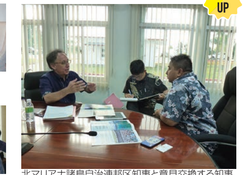
北マリアナ諸島自治連邦区知事と意見交換する知事