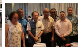
現地交流会でサイパン市長と