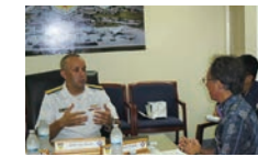
北マリアナ統合軍司令官と意見交換する知事