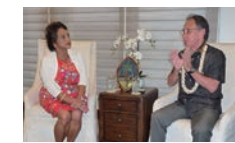
グアム準州知事と意見交換する知事