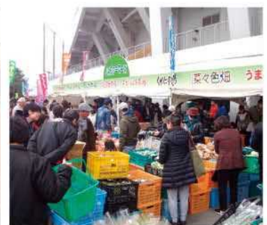
農産物販売コーナー