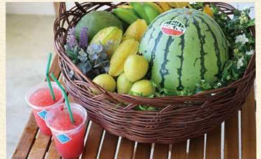
特産品のスイカ。沖縄では、「スイカ」といえば今帰仁といわれるほど知られた存在です。