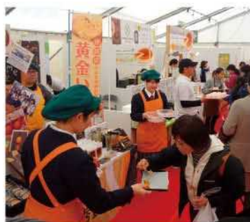
島ふ〜どグランプリ