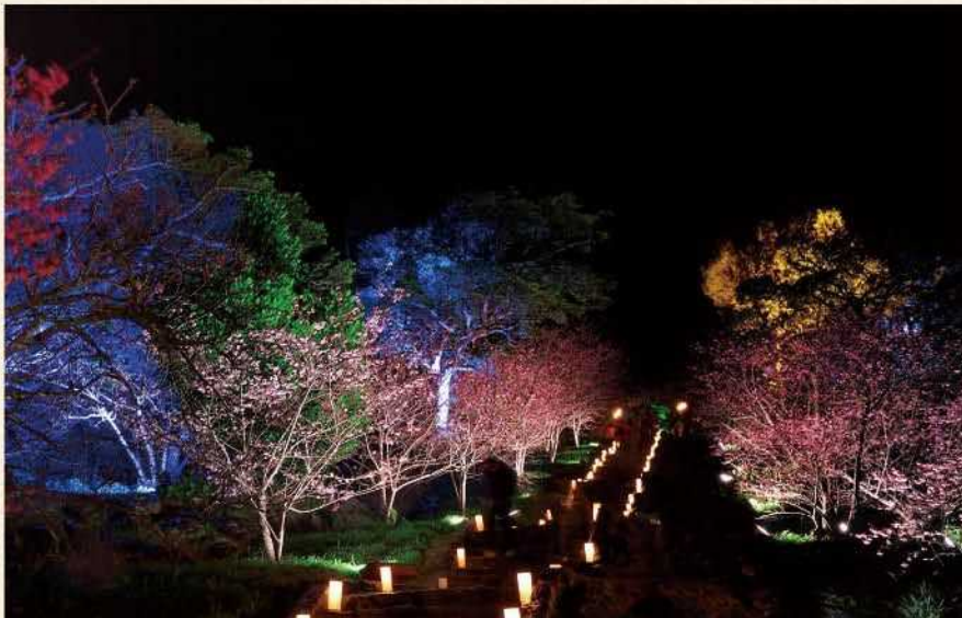
世界遺産の今帰仁城跡では、毎年1月下旬から2月上旬に「今帰仁グスク桜まつり」が開催され、日没後の城壁の魅惑的なライトアップが訪れる人々を幻想的な世界へと誘います。

日本早く出荷される今帰仁村のスイカ。糖度が11度以上ある今帰仁産のスイカはシャリシャリとした食感が特徴で、クリスマスや年末の贈答用としても県内外へ出荷されています。他にも、マンゴーやぶどうの果樹に加え、実はキノコの生産も行われており、今帰仁産のき・エリンギ・クロアワビ茸は県内で人気が高まっています。 また、世界遺産に登録され、琉球王国グスク及び関連遺産群の一つでもある「今帰仁城跡」や、穴場ビーチとして人気が高い「村民の浜」、車で行ける離島「古宇利島」は、透明度の高い海を走り抜ける橋からの景観が素晴らしく県外からもたくさんの方の観光客が訪れます。2月上旬から開催される、「今帰仁グスク桜まつり」では全国でも珍しい寒い時期の桜を鑑賞できるとあって多くの方が集まる人気のお祭りです。近年では、若者に人気のカフェや雑貨屋も増え、ショッピングが楽しめる、自然や歴史を体験できる村として注目されています。