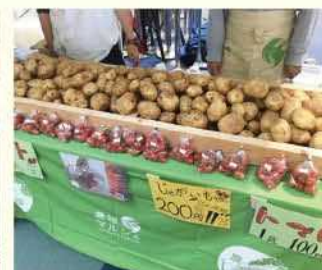
農福マルシェの様子