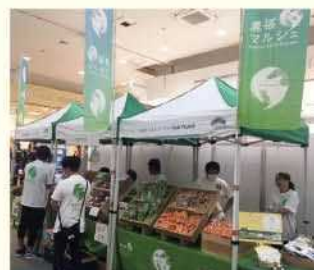
農福マルシェの様子

農福連携は、障害のある人もない人も共に地域で暮らし、生きがいを創り、高め合うことができる地域共生社会の実現に向けた取り組みの一つです。皆さんも、農福連携に取り組んで見ませんか。