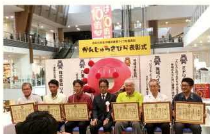
がんじゅうさびら表彰式

みんなのお父さんお母さん世代へ向けて、「職場の健康力アップ支援事業」を実施してい るよ。これは働く人の健康づくりを実施した い企業を、企画・立案から実施まで支援した りする事業で、他にも地域や職場で健康づく りに取り組んでいる人たちを知事表彰（がん じゅうさびら表彰）して盛り上げたり、会 社のトップ向けには「健康経営ハンドブック」 を配布するなど、会社全体で健康に対する意 識を高めるよう促しているよ。もちろん、君 たちのような子どもに向けての取り組みも実 施しているよ。