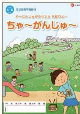
小学生や中学生に配布される副読本