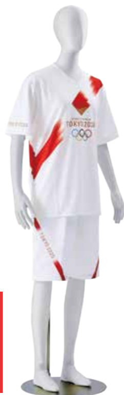
ユニフォーム 半袖

聖火ランナーのユニフォームについても日本のリレーで伝統的に使用される襷(たすき)をモチーフとしており、環境への配慮からPETボトルをリサイクルした素材が用いられています。