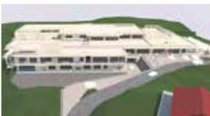
「おきなわ工芸の杜」完成イメージ図

今後、人・技・情報の交流拠点として、沖縄工芸の様々な情報発信や人材育成、製品開発の支援を行っています。