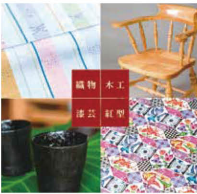
工芸技術者研修生の作品

県工芸振興センターでは、沖縄の文化産業として大切に受け継がれてきた伝統工芸の技術者育成や技術者支援のほか、伝統工芸の調査研究を行っています。