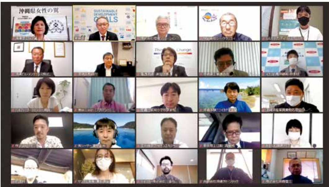
令和3年3月にご登録いただいた皆さま