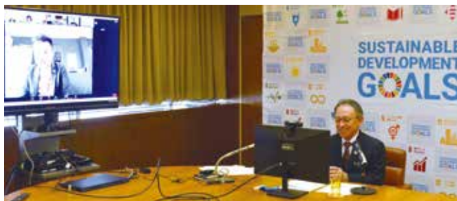
オンラインによる登録式の様子