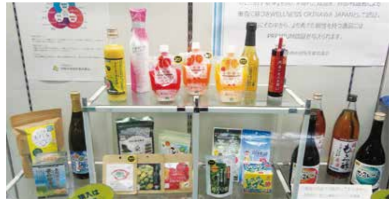
ウェルネスオキナワジャパン(WOJ)認証商品

認証商品は、各社WEBサイト(県ものづくり振興課HP参照)や沖縄宝島浦添パルコシティ店で購入できます。