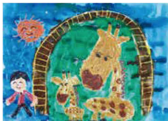
令和2年度動物愛護図画コンクール 沖縄県知事賞

動物を「飼っている人」も「飼っていない人」も、この週間をきっかけに「人」と「動物」のよりよい関係を考えていただきたいと思います。