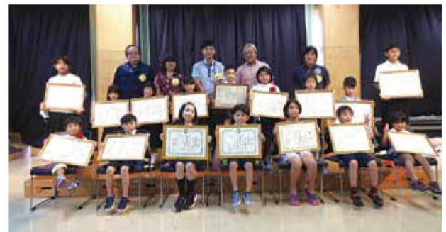
令和2年度 動物愛護の集い(図画コンクール表彰式)