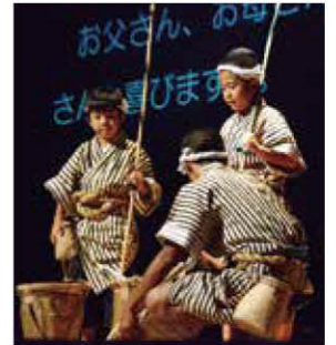
しまくとぅば 語やびら大会

その中でも、今年で第26回目を迎える「しまくとぅば語やびら大会」では、各市町村文化協会及び市町村の推薦を受けた話者が、それぞれの地域自慢の「しまくとぅば」を披露してくれます。