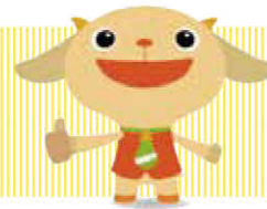
グジョブ運動 キャラクター 「ジョブたん」