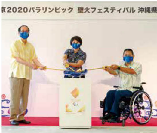
8月14日 東京2020パラリンピック 聖火フェスティバル 沖縄県集火・出立式