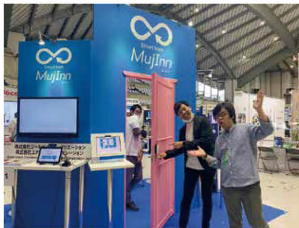
前回開催時の様子（令和2年10月29日～11月1日）