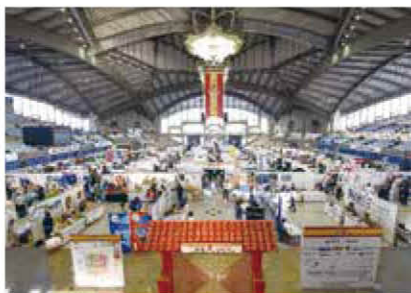
県内外から集まった企業と、海外のバイヤーが出会う場となる「沖縄大交易会」。 (写真は第7回沖縄大交易会2019)