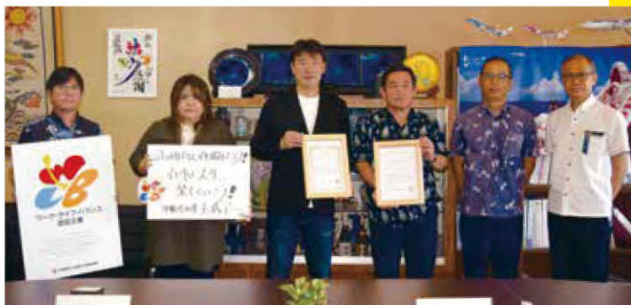
沖縄県ワーク・ライフ・バランス認証企業 三協電気工事(株)、アディッシュプラス(株)

その取組の一つとして、仕事と生活の調和の実現のため、平成28年度より九州・山口ワーク・ライフ・バランス推進キャンペーンを実施し、九州山口地域の企業の男性育休取得促進等の優れた取組をウェブサイトで広く情報発信する等、様々な事業に取り組んでいます。