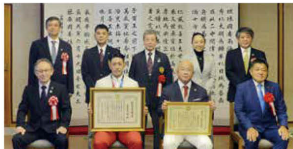
喜友名選手と佐久本氏の表彰式

(空手道において、後進の育成に努め、国際大会で多数の優秀な選手を優勝に導き、東京2020オリンピックでは空手競技・形の喜友名諒選手を金メダル獲得に導いた)