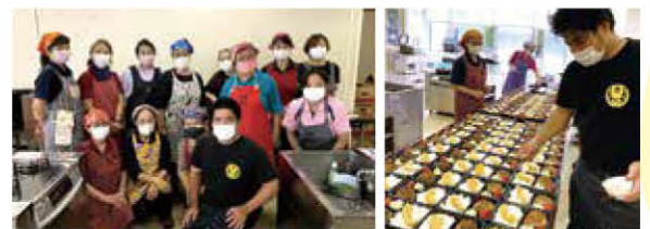
こども未来協力店：「ちねんや〜」の皆さん

居場所の休止等や時短営業等により厳しい経営状況の中、「食事に困った地域の方々を見過ごす訳にはいかない！」と立ち上がり、食支援に取り組んでいます。