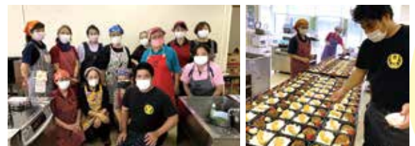
こども未来協力店：「ちねんや〜」の皆さん

居場所の休止等や時短営業等により厳しい経営状況の中、「食事に困った地域の方々を見過ごす訳にはいかない！」と立ち上がり、食支援に取り組んでいます。