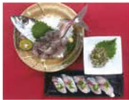
メアジの姿づくり・握り・なめろう