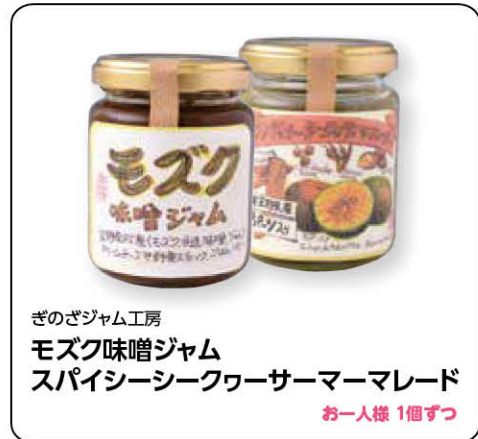
ぎのぞジャム工房 モズク味噌ジャム スパイシーシークワサーマーマレード お一人様 1個ずつ

美ら島沖縄・うまんちゅひろばのアンケートにお答えいただいた方から抽選で、 毎月10名様に県産品をプレゼント!