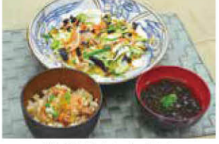
マガキガイ炊き込みごはん モズクの吸い物

県内では、マグロ類以外にも、ソデイカ、マチ類、ブダイ類、ハタ類をはじめ500種以上もの水産物が水揚げされています。スーパーなどでよく見かける魚以外にも、サワラ類(さら:ヨコシマサワラ・カマスサワラ)やカマス類(かまさー)、アジ類(がちゅん:メアジ、がーら:カスマアジ、オニヒラアジなど)、ドロクイ(あしちん)、クロシビカマス(なわきり)といった、あまり知られていませんが、実はおいしい魚や地域限定