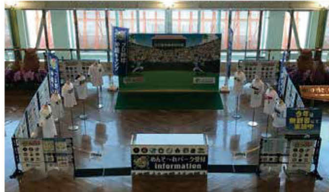
プロ野球沖縄キャンプブース「めんそーれパーク」(那覇空港内)