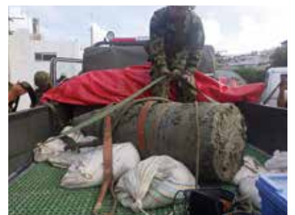
令和2年7月八重瀬町 [16インチ艦砲弾]