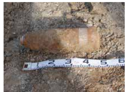
令和3年9月南風原町 [5インチ艦砲弾]