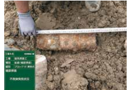
令和3年11月那覇市 [105mm発煙弾]