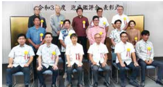
令和3年度 泡盛鑑評会表彰式