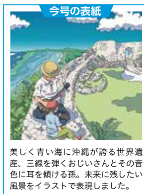
今号の表紙 美しく青い海に沖縄が誇る世界遺産、三線を弾くおじいさんとその音色に耳を傾ける孫。未来に残したい風景をイラストで表現しました。

沖縄の未来のためにできることって なんだろう？ 答えはいろいろあり ますが、一人ひとりの小さな行動も すべて未来へつながります。