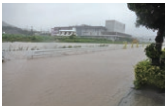
西原町 小波津川(令和元年6月)

令和元年5月の豪雨により、与那国町に位置する田原川において、護岸の崩落や周辺集落での床上・床下浸水の被害が発生しました。更に、同年6月には小波津川(西原町)、11月には白比川(北谷町)でも、記録的な豪雨によりその周辺で床上・床下浸水の被害が発生しました。