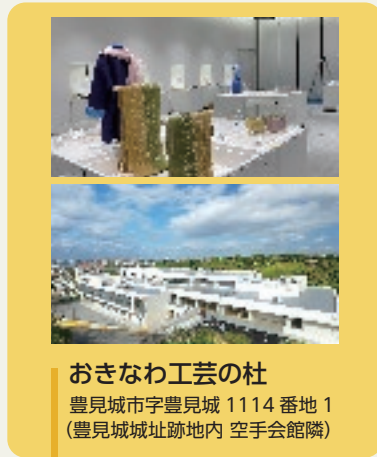
おきなわ工芸の社 豊見城市字豊見城 1114 番地 1 (豊見城址跡地内 空手会館隣)

問い合わせ ものづくり振興課 電話:098-866-2337 FAX:098-866-2447