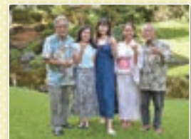
小淵奨学生(中央3名)と ハワイ東西センターの職員