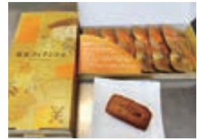
卵白を活用したフィナンシェ