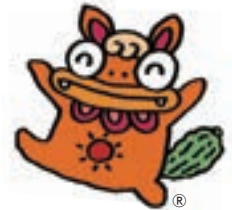
沖縄県農林水産物 マスコットキャラクター 「イーサーくん」