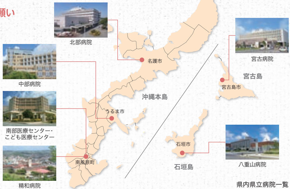
県内県立病院一覧

県立病院は、地域における中核的な公的医療機関として、救急医療を担うとともに、かかりつけ医からの紹介などによって、主に高度医療など民間医療機関で対応の困難な医療や地域で不足する医療を提供しています。発熱や咳、喉の痛みといった軽症の場合はまず、地域のクリニック等にご相談下さい。必要な人に必要な医療が届けられるよう、ご協力宜しくお願いします。