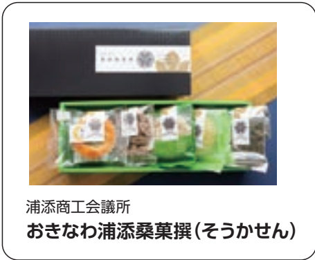
浦添商工会議所 おきなわ浦添桑葉撰(そうかせん)

美ら島沖繩・うまんちゅひろばのアンケートにお答えいただいた方から抽選で、 毎月10名様に県産品をプレゼント!