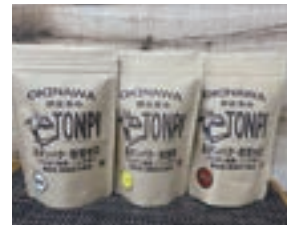
豚皮を活用したチップス