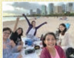
浜辺で友人とオフタイム