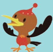
沖縄21世紀ビジョンキャラクター げんこ2121