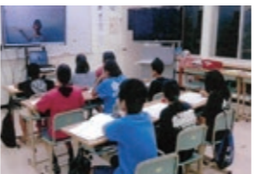
遠隔地授業(北大東村)