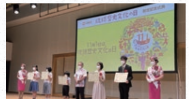
昨年度の式典の様子

県では、令和4年11月1日（火）に“琉球歴史文化の日記念イベント”を実施します。記念イベントでは、第7回世界のウチナーンチュ大会と連携し、海外移民の歴史をテーマとした記念講演及びシンポジウムを開催します。記念講演等の内容について特設サイトで後日配信しますので是非ご覧ください。