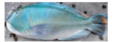
シロクラベラ(方言名: マクブ)