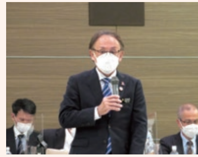
玉城知事が会議で発言している様子