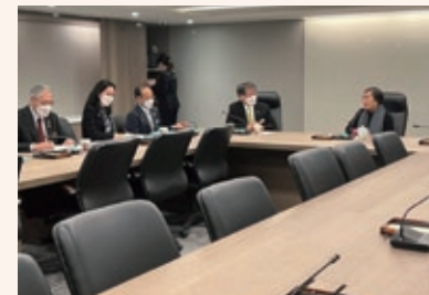
台湾観光協会会長との意見交換の様子

航空会社からは、台北以外の都市との路線の早期回復や運航便数の増便についての前向きな発言があったほ