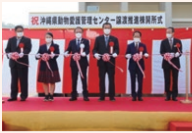
動物愛護管理センター開所式の様子