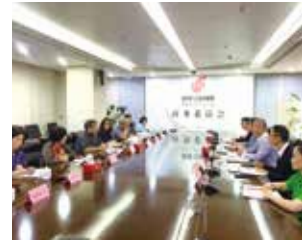
中国国際航空との意見交換