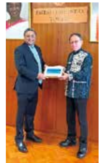
シビ・ジョージ駐日インド大使と玉城知事