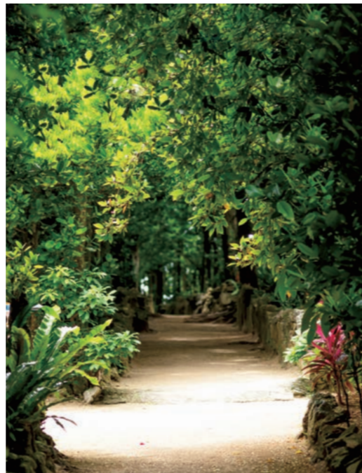
Hiler de árboles Fukugi/Ciudad de Motobu