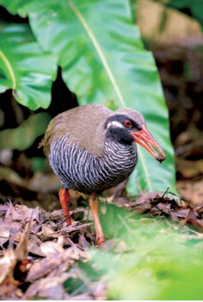
Rascón de Okinawa (Yanbaru kuina)