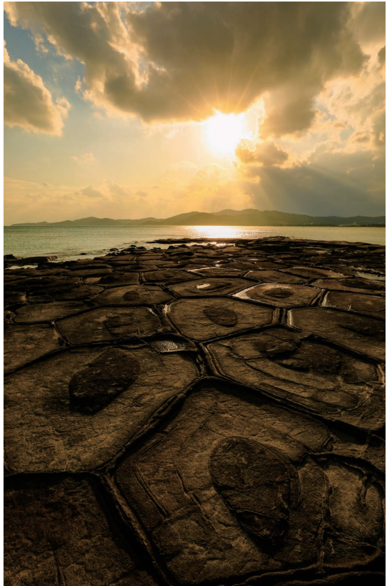
Tatami de rocas (roca caparazón de tortuga)/Isla Kume