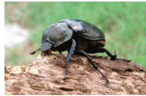
Escarabajo de brazos largos de Yanbaru