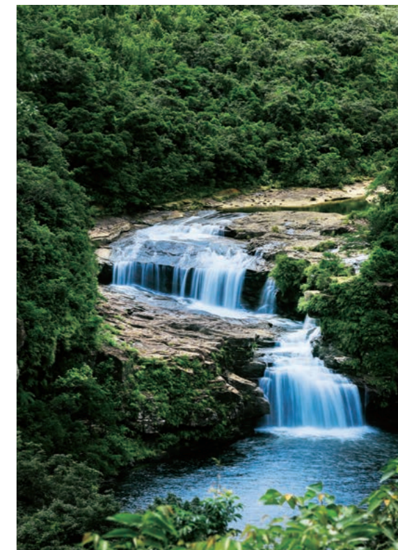
Cachoeira de Maryudu / Ilha Iriomote