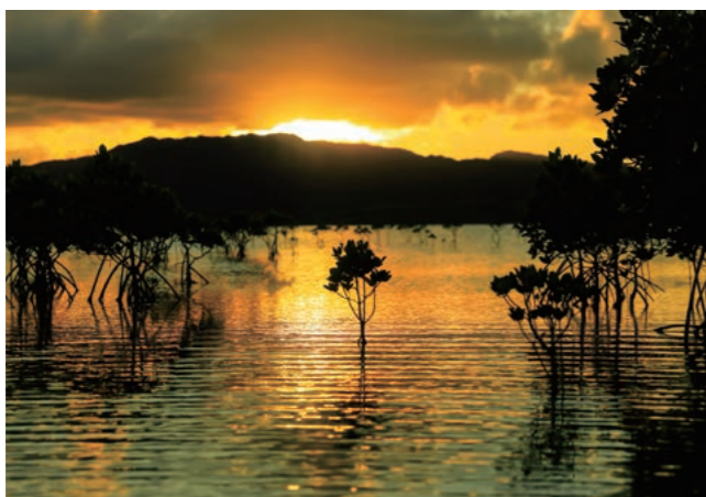
Mangue/ Ilha Kohama