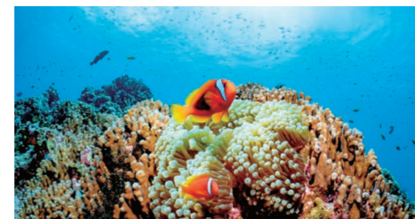
Recifes de corais se estendem por todo o mar ao redor de Okinawa

A Prefeitura de Okinawa é uma região subtropical, e é abençoada com um clima agradável ao longo do ano. As águas azuis ao redor da ilha são um tesouro de peixes tropicais, recifes de corais e outras criaturas. E na parte norte da ilha principal de Okinawa e em ilhas remotas, existem florestas semelhante a uma selva, que abrigam animais, plantas e insetos que são únicos mesmo dentro e fora do Japão. A natureza é uma das coisas das quais a Prefeitura de Okinawa pode se orgulhar no mundo.