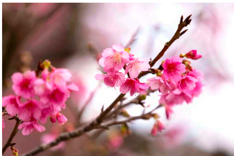
Cerejeira flor de sino (Kanhizakura)

A riqueza da natureza nesta ilha é o que atrai e impressiona muitas pessoas