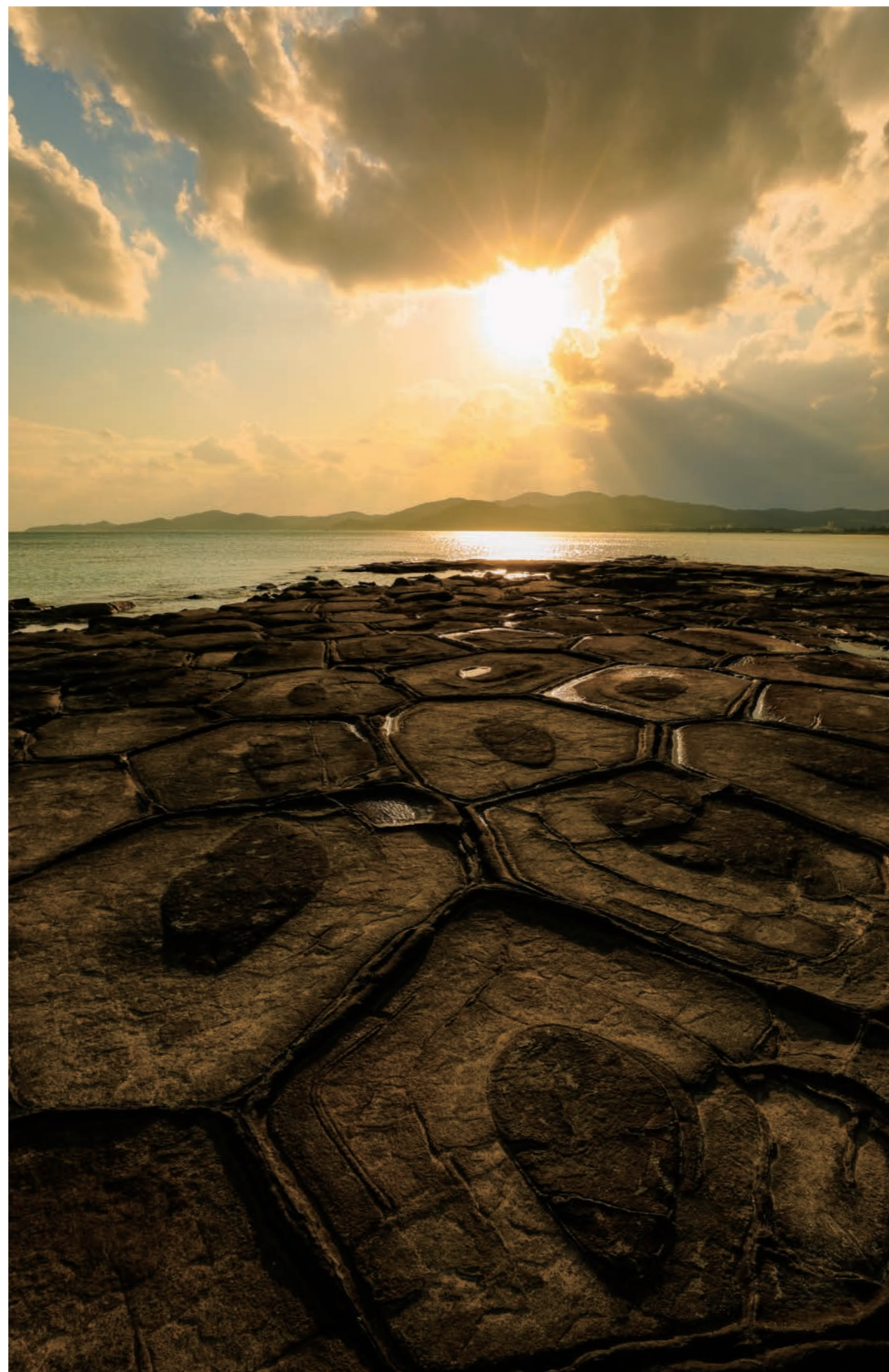
Rochas de Tatame (pedra casco da tartaruga) / Ilha Kume