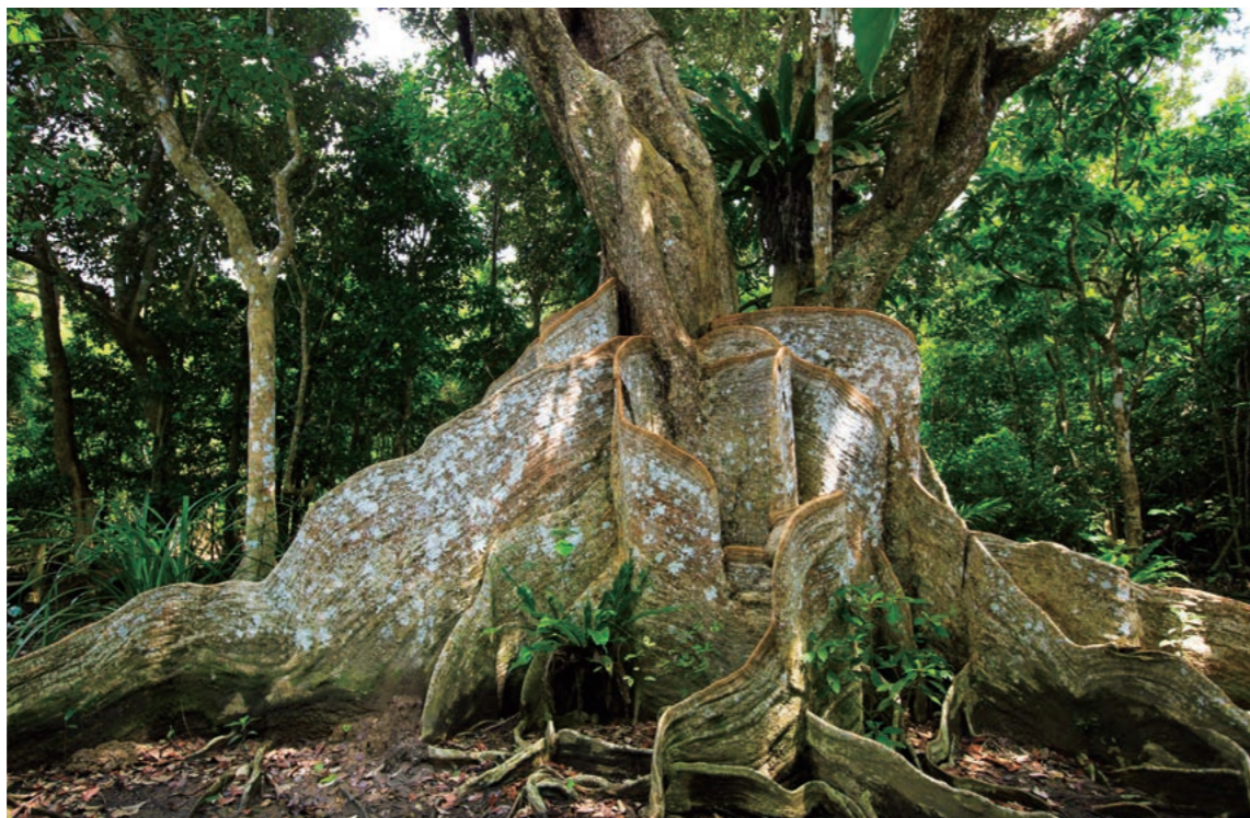
Manguezal de espelho / Ilha Iriomote

A riqueza da natureza nesta ilha é o que atrai e impressiona muitas pessoas