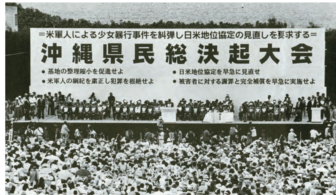
壇上には関連団体の代表らが顔を揃えました。

米軍人による少女暴行事件を糾弾し、日米地位協定の見直しを要求する県民総決起大会が宜野湾海浜公園で開催されました。