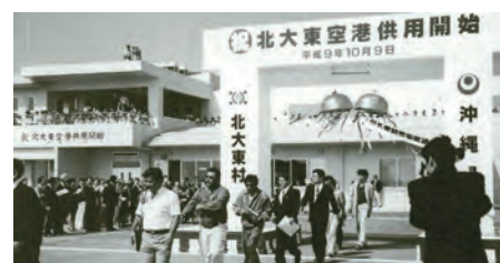
定期便に搭乗する利用客