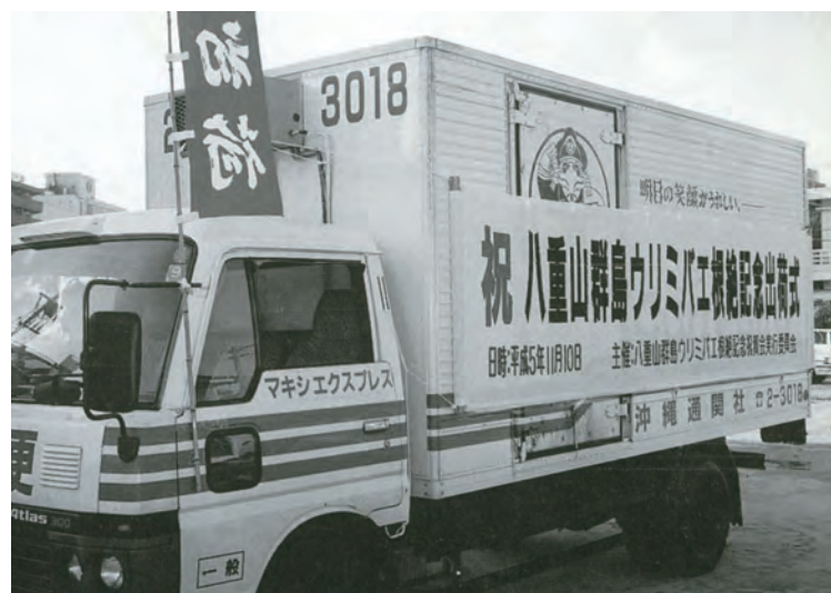
八重山地域からも多くの野菜や果樹が「初荷」として本土に出荷されました。

ウリミバエはウリ類やトマトなどの果実を食い荒らす害虫で、1919年に八重山群島で確認されて以降、沖縄県全域に広がりました。県は復帰を機にミバエ類の根絶防疫事業に着手し、約530億匹の不妊虫を放つことでウリミバエを全県で根絶することに成功しました。