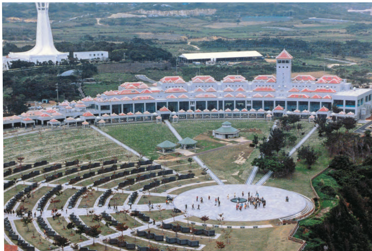
「平和の礎」の全景。その奥には、沖縄県平和資料館、沖縄平和祈念堂が見えます。