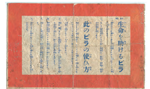
戦中にばらまかれたビラなども展示されている。