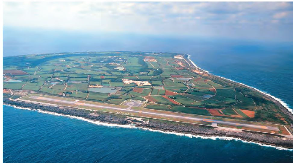
旧空港を拡張整備し供用開始。