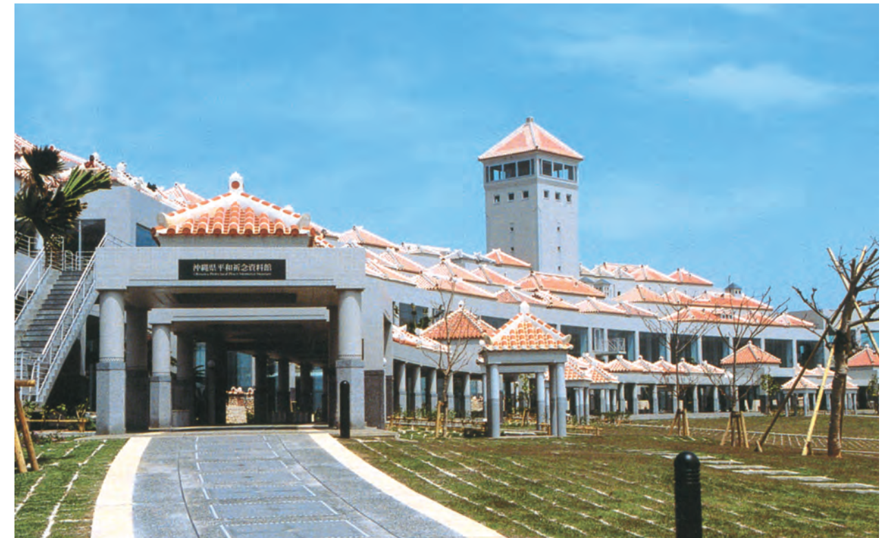
糸満市摩文仁に完成(移転改築)した沖縄県平和祈念資料館