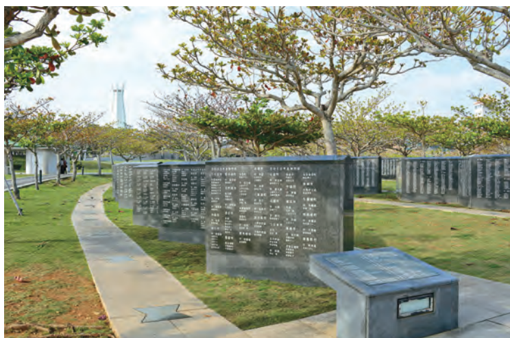
国籍を問わず戦没者の名が刻まれた「平和の礎」