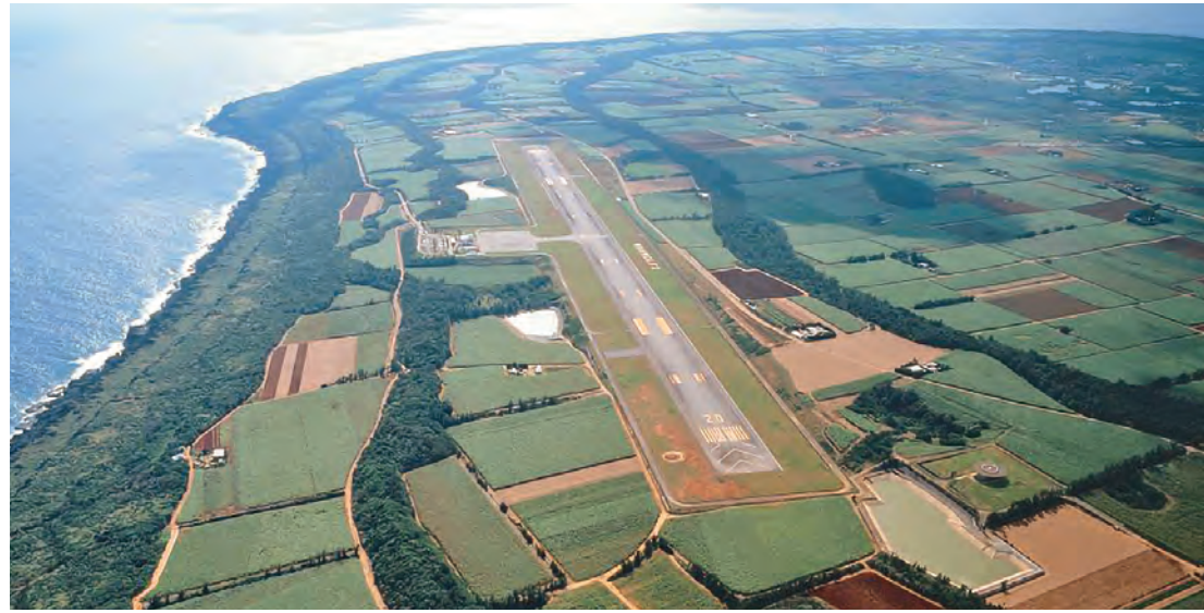
旧空港を廃止し、新空港として移転整備。