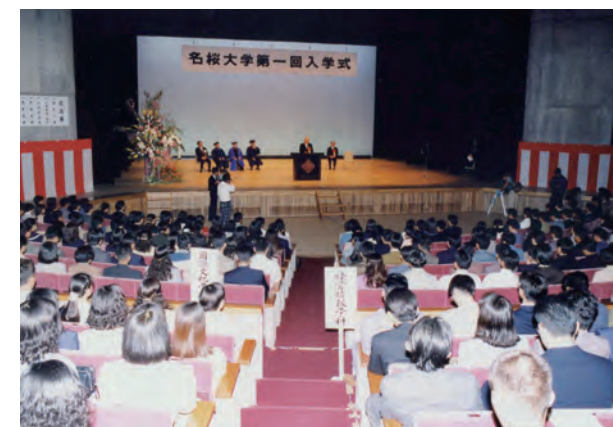
第1回入学式の様子=名護市民会館