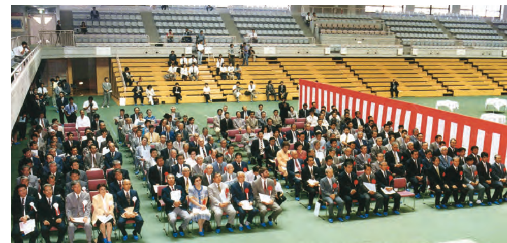
落成式典には、国や県をはじめ多くの関係者が出席しました。