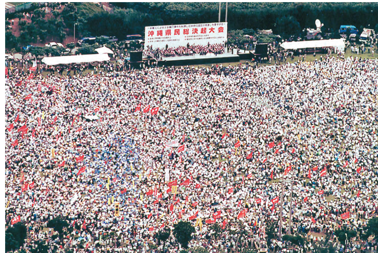
会場の宜野湾海浜公園は8万5000人の参加者で埋まりました。