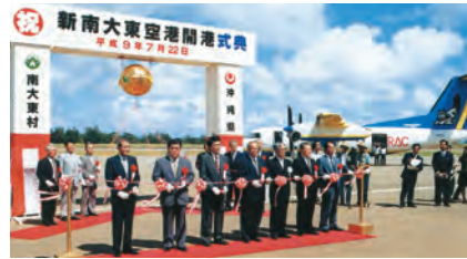
関係者によるテープカット