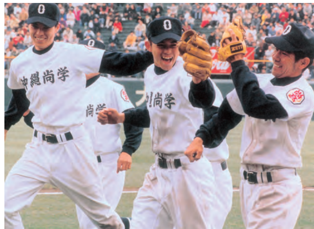
準決勝で強豪のPL学園を下して喜び合うナイン