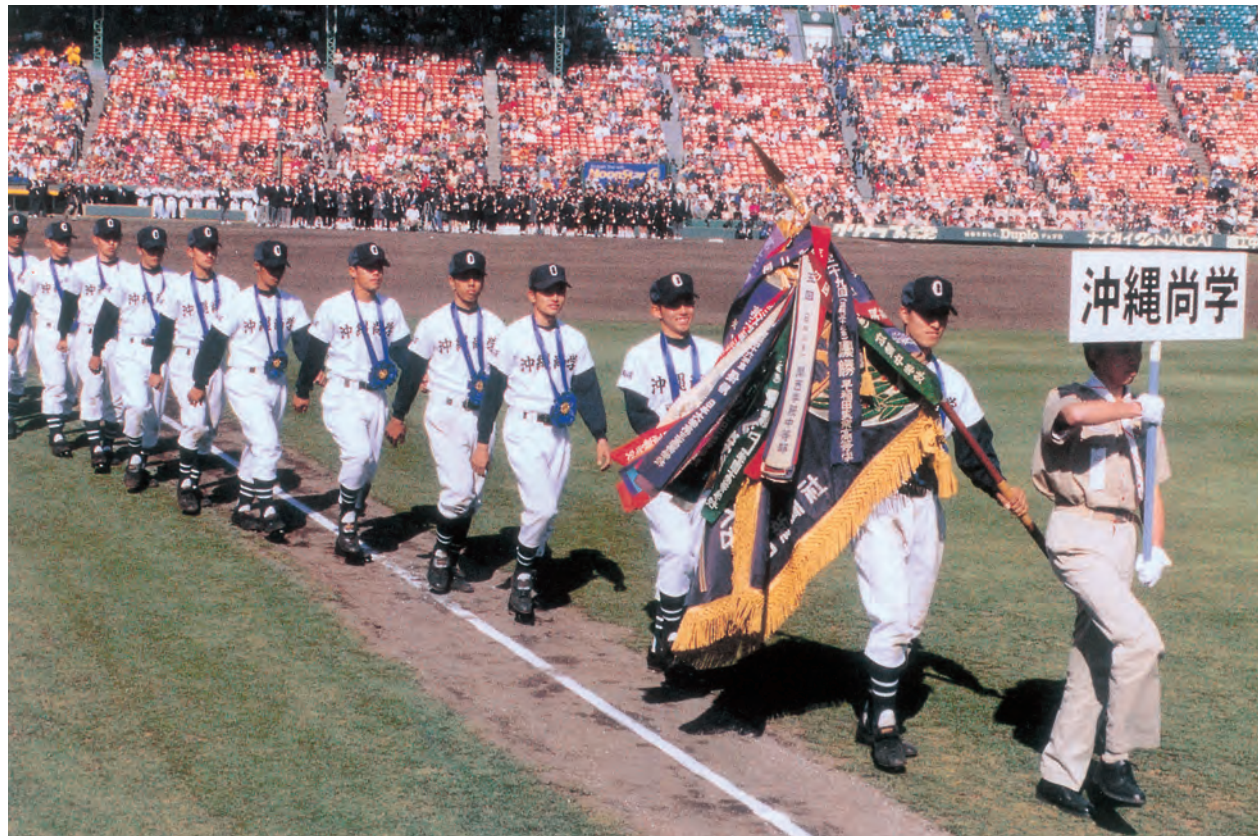
優勝旗を先頭に球場内を行進