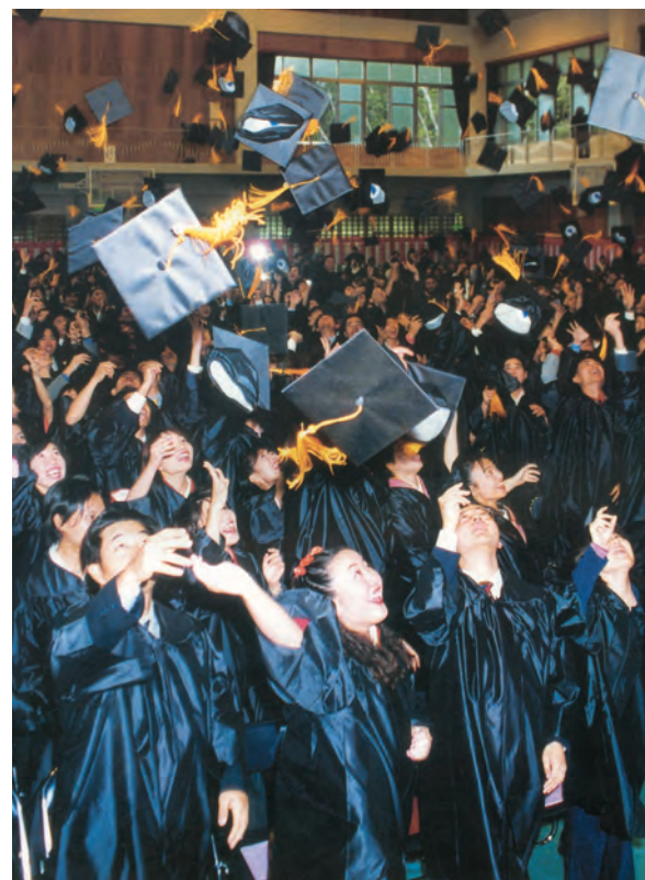
1998年、第1期生の卒業式