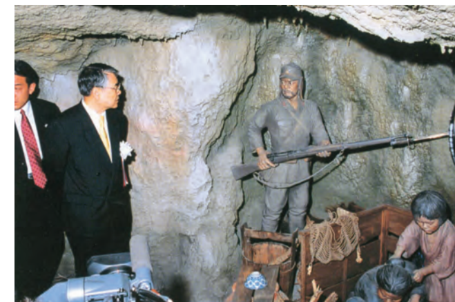
ガマの模型展示を見学する稲嶺恵一知事