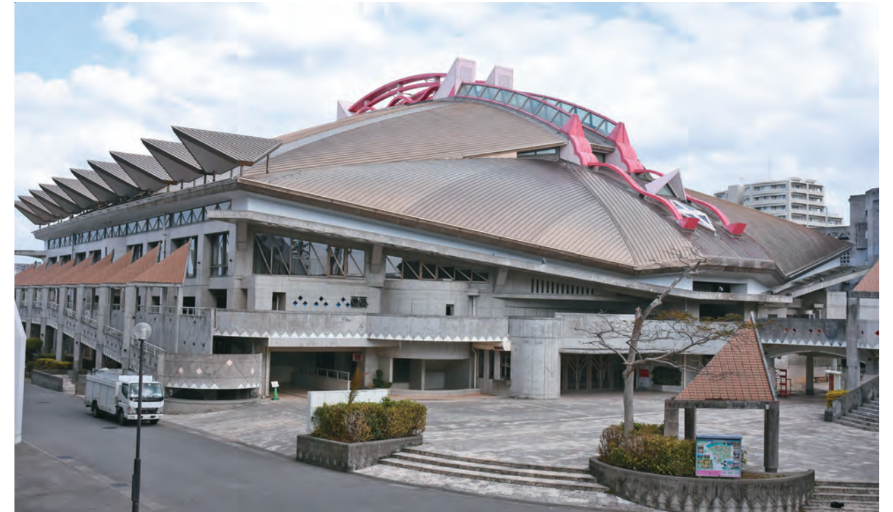
アリーナ棟の外観