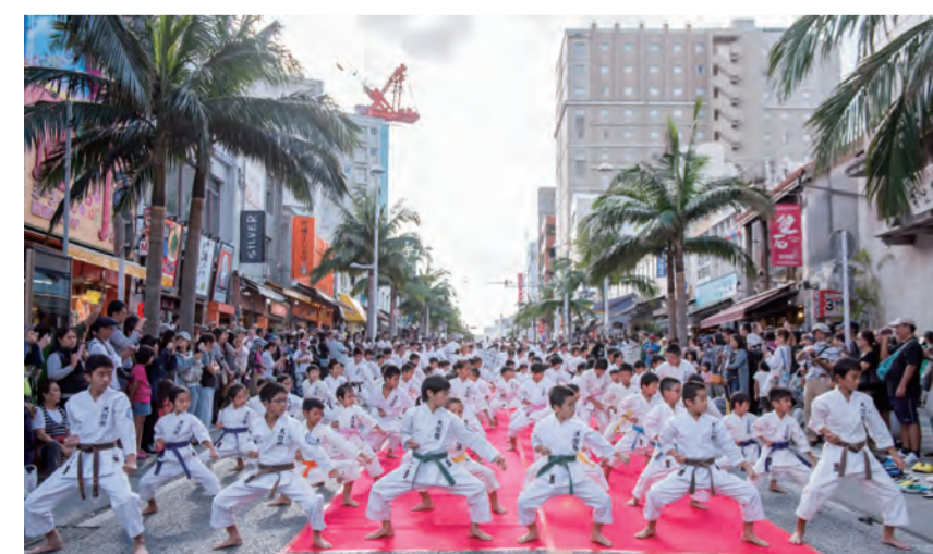
空手の日記念演武祭