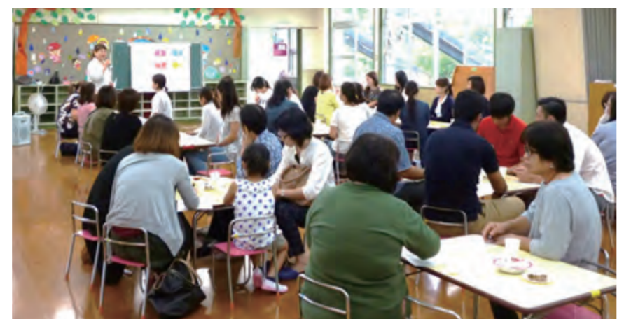
保護者が家庭教育について共に気付き、考え、楽しく学び合う「親のまなびあい」プログラムの様子