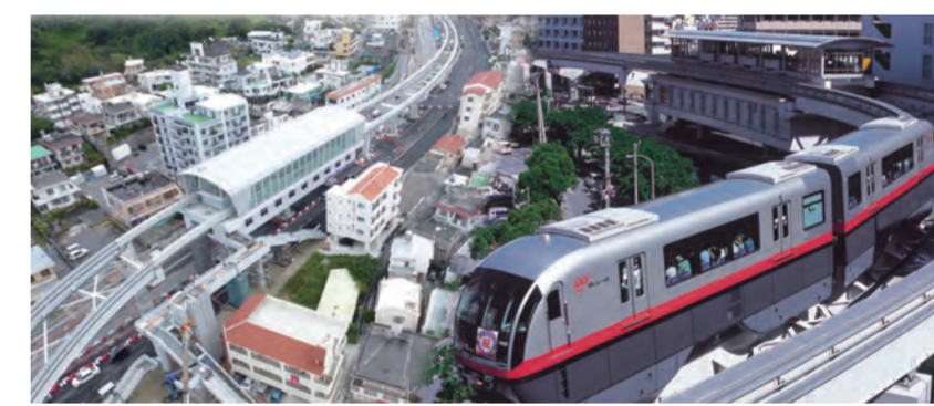
整備中のゆいレール浦添前田駅