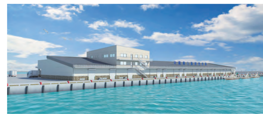
糸満市新市場のイメージ図