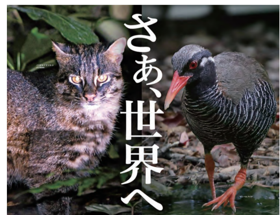
やんばる地域、西表島を世界自然遺産へ