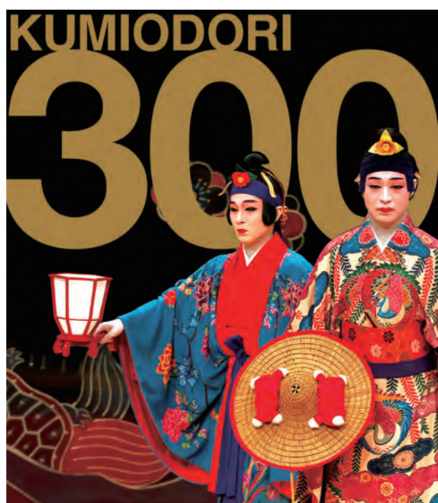
組踊上演300周年記念事業のポスター