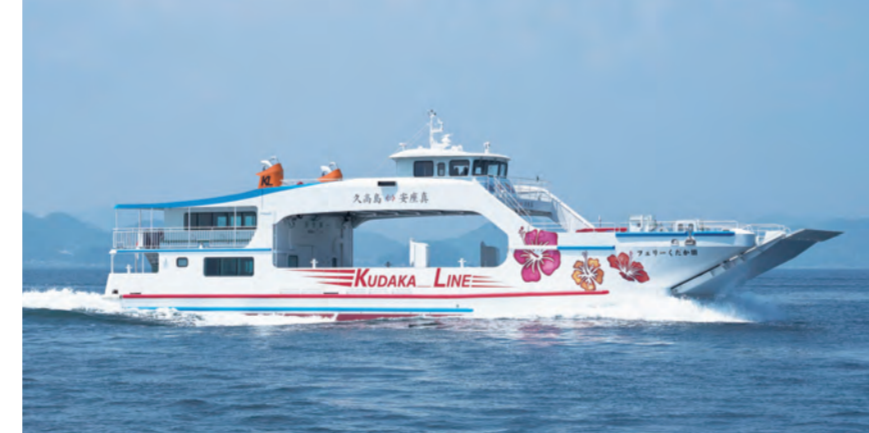
(上)みやこ下地島空港ターミナルと全景 (下)離島航路に就航する船舶の建造支援