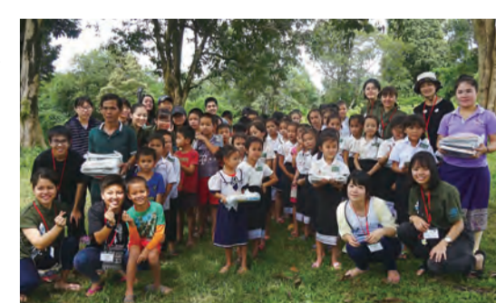
ラオス 現地の子供達と交流