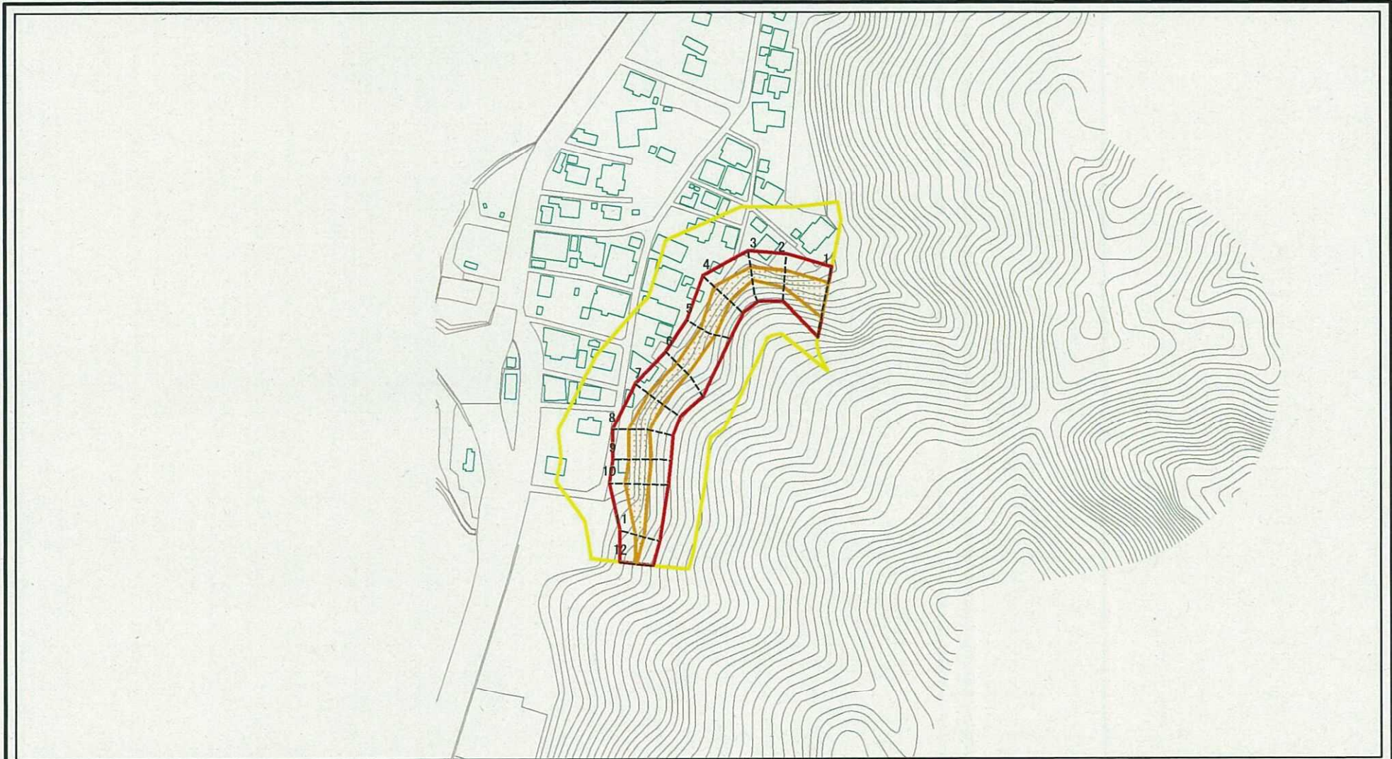
図中の数字は横断測線番号を示す