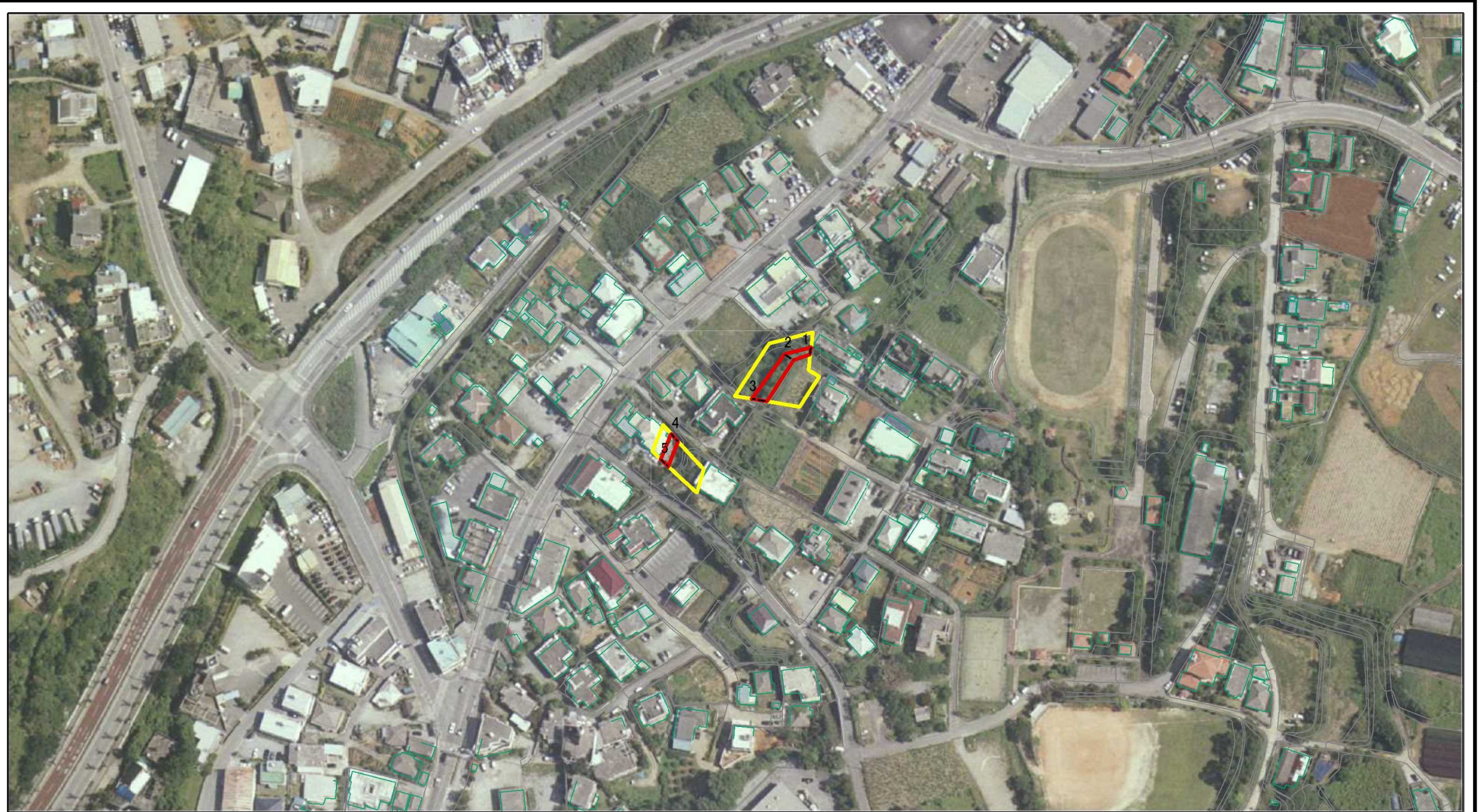
図中の数字は横断測線番号を示す