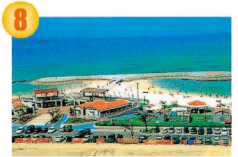
あざまサンサンビーチ 県庁から約24km/45分