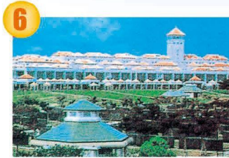
平和祈念公園 県庁から約20km/30分