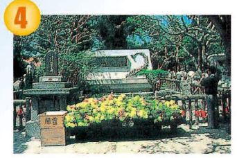
ひめゆりの塔 県庁から約16km/30分