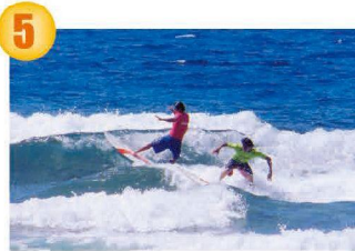
米須海岸 県庁から約17km/35分