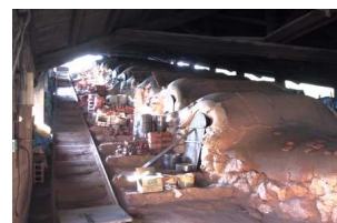
① やちむんの里 世界遺産の座喜味城跡近くにあり、嘉手納弾薬庫跡地につくられた陶器の里

また、20数カ国の人々が住む沖縄市では異国情緒漂う雰囲気をもつ「中央パークアベニュー」、「空港通り」等のショッピング街や、うるま市と沖縄市の闘牛、焼き物の産地である読谷村のやちむんの里、さらに、中部の各市町村で盛んなエイサーなど文化の香りがいっぱいです。