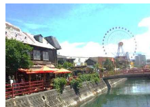
④ アメリカンビレッジ 北谷町美浜の中心的な観光スポットとして定着。大観覧車を目標にルート58を北上しよう