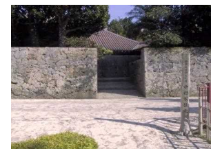
⑤ 中村家住宅 戦前の沖縄の上層農家居住建築の特色をすべて備えている建物、国の重要文化財