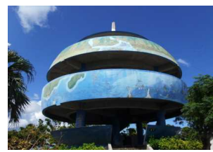
⑦ 嘉数高台 嘉数高台周辺は沖縄戦で最大の激戦地となったが、現在は公園として整備されている。展望台からは普天間飛行場が一望できる。