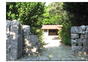
⑨ 内間御殿 第二尚氏王統の始祖である金丸(のちの尚円王)が内間地頭に任ぜられてときの旧住宅跡地に、尚円王没後190年後に建てられた神殿である。