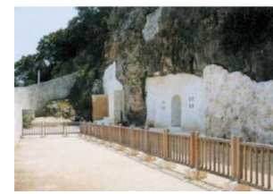
⑧ 浦添ようどれ テダコ(太陽の子の意)と呼ばれた英祖王のお墓。浦添グスクの北側崖下にあり、厳肅な雰囲気だ