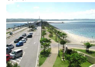
⑥ 海中道路 与那国島と平安座島を結ぶ全長5kmのルート。ほぼ中央部にロードパークがあり海水浴も楽しめる。