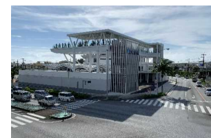
② 道の駅かでな 米軍嘉手納飛行場が一望でき、レストランや町の特産品展示販売場もある。