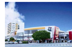
③ コザミュージックタウン 多目的ホールと音楽スタジオ等の施設やコザらしさが味わえる様々なテナントが入店している。