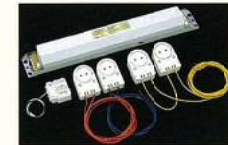
・安定器をインバータ型に更新しエネルギー削減