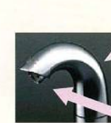
水力発電で 電源不要