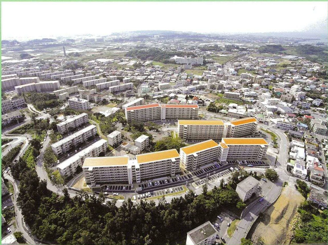
豊見城団地県改良住宅（豊見城市）