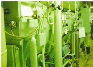
更新前 吸収式冷凍機