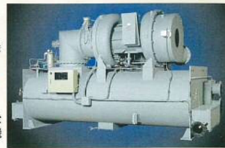
更新後 NVターボ冷凍機