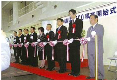
(↑写真は、平成20年3月25日のESCO事業開始式)