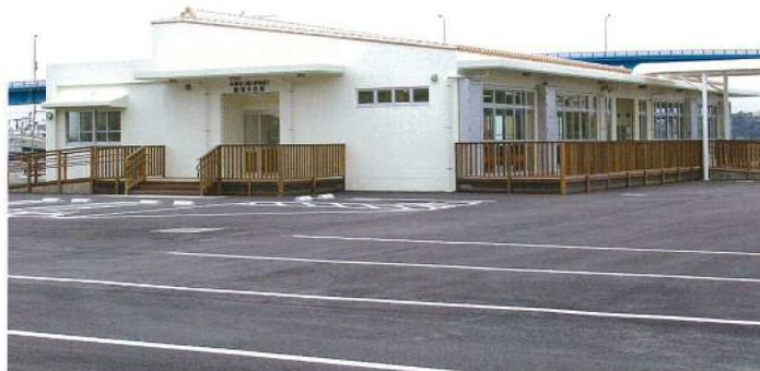
本部港（渡久地地区）浮棧橋付属施設外観写真

白い砂浜と輝く太陽の海浜レジャーを思い描き整然と並ぶイスでくつろぎ青い海と近くの公園と外部のウッドデッキで沖縄の気候を十分堪能できる空間を配置し、内部空間を広く高く感じる様な設計と屋根を赤瓦葺きとし柔軟性をイメージした木製の手摺を採用した。