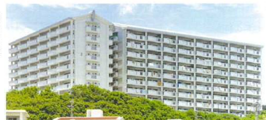
スカイラインを形成する破風と面（チラ）出し

屋根部分は、自然を借景して遠景からの景観形成を図るため、瓦葺きをイメージしている。また、妻側にはスカイラインへのアクセントとなる破風と面（チラ）出しを採用し、切妻屋根としている。