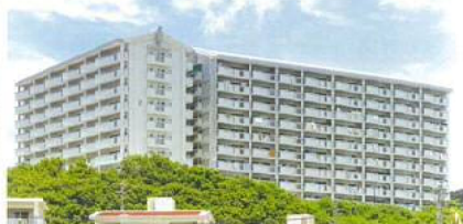
C棟（第2期工事）及びD棟（第3期工事）