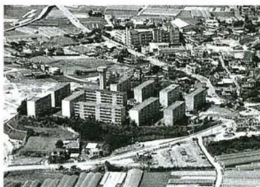
従前の渡橋名団地

県営渡橋名団地はこの促進計画に基づいて建替を重点的に推進すべき団地として指定を受けており、平成10年度の再生団地計画の策定、平成12年度の基本・実施設計を経て平成13年度に県営住宅では県営平良団地に次ぐ2例目となる建替工事に着手している。第1期工事、第2期工事は、既に完成しており、今期で当団地は事業完了となる。