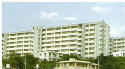
A棟及びB棟（共に第1期工事）