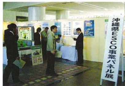
(↑写真は、3月25日～27日に開催したパネル展)

建物概要 地下2階、地上14階、塔屋3階・SRC造 床面積 78,243㎡・竣工年:平成2年