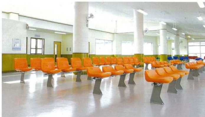
本部港（渡久地地区）浮棧橋付属施設内観写真