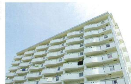
サトウキビの葉の揺れをモチーフにしたバルコニー

バルコニー及び共用廊下の手すり形状は、日園地帯である渡橋名一帯に広がるサトウキビの葉が風に揺れているイメージをモチーフに曲線を月いた計画としている。