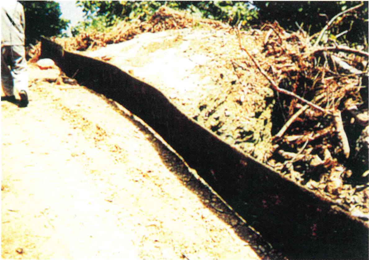
柵材に透水性の土木シートを用いた例

写真の例は、柵材下端と地表面の間に隙間があり、対策効果が十分発揮されていない（要改善事例）。