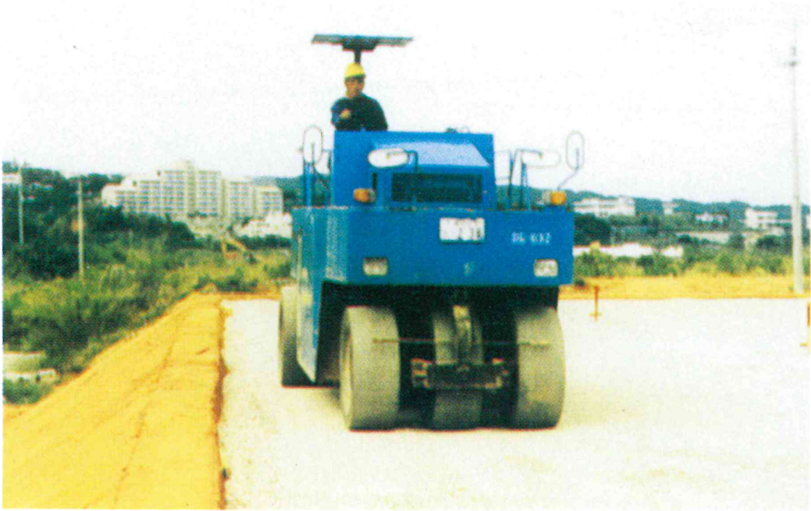
宅地造成における砂利敷設の状況