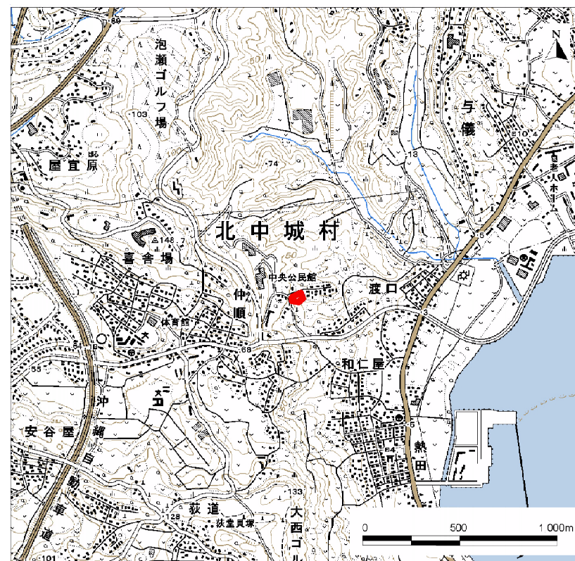
( 1/25,000 )